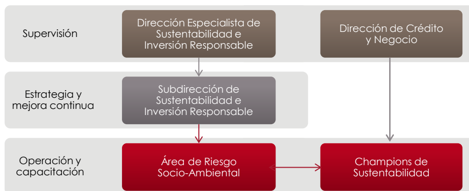
Figura 1. Estructura organizacional del SEMS

El ARSA es apoyado por un grupo de colaboradores del área de Crédito llamadas Champions de Sustentabilidad, que fungen como vínculo con las áreas de Crédito y Negocio para permeare la adecuada gestión de riesgos ambientales y sociales a nivel nacional.