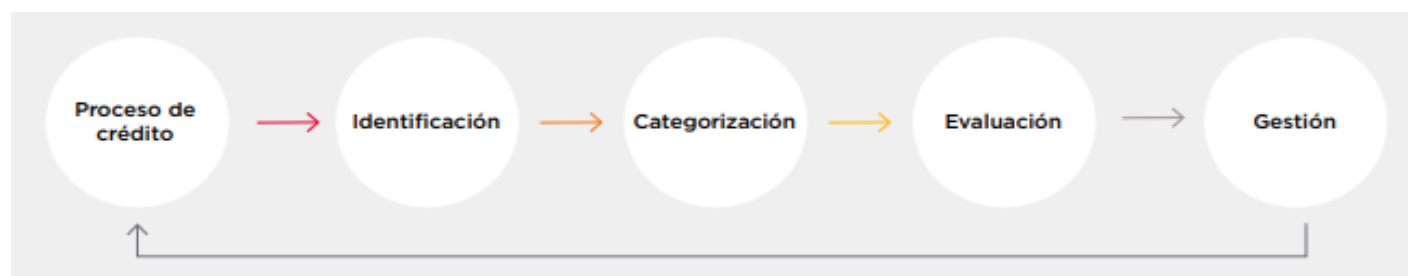
Figura 2. Proceso SEMS

El proceso de análisis consiste en la identificación, categorización, evaluación y gestión de riesgos e impactos que son comunicados a los Comités de Crédito, previo a la autorización de los financiamientos.