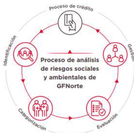
Figura 2. Proceso SEMS