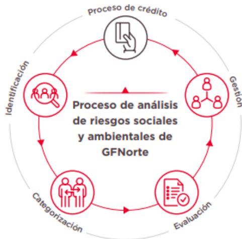
Figura 1. Proceso SEMS