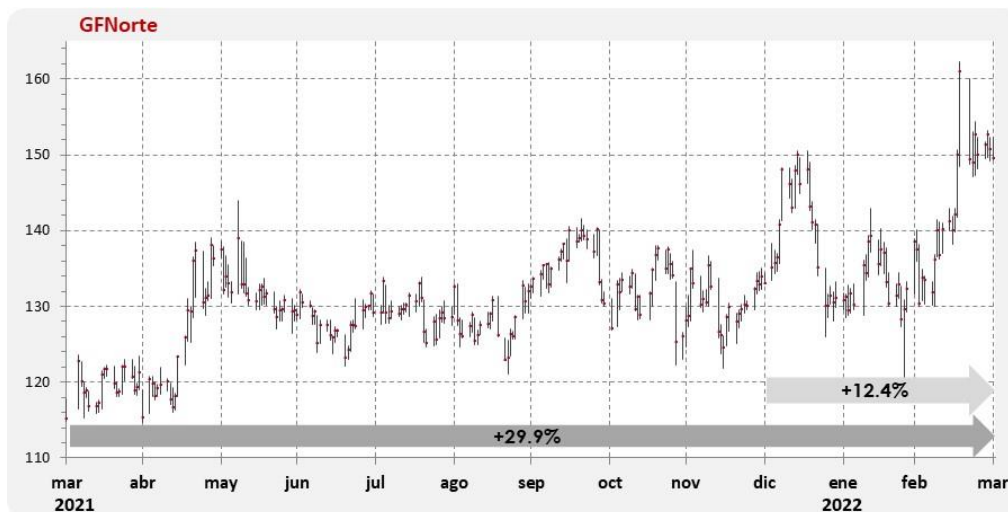
Gráfica 3. Comportamiento Anual de la Acción

El grupo reportó una Utilidad por Acción de $3.728 pesos en el 1T22.