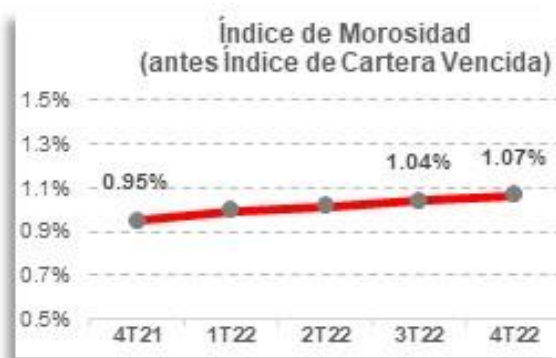
Gráfica 2. Índice de Morosidad