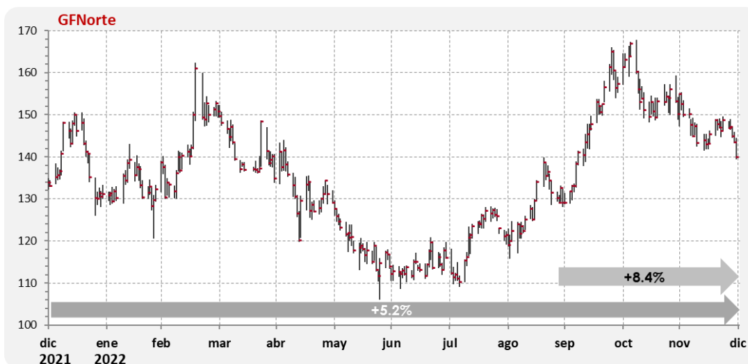
Gráfica 3. Comportamiento Anual de la Acción

El grupo reportó una Utilidad por Acción de $15.748 pesos en 2022 y de $ 4.020 pesos en el 4T22.