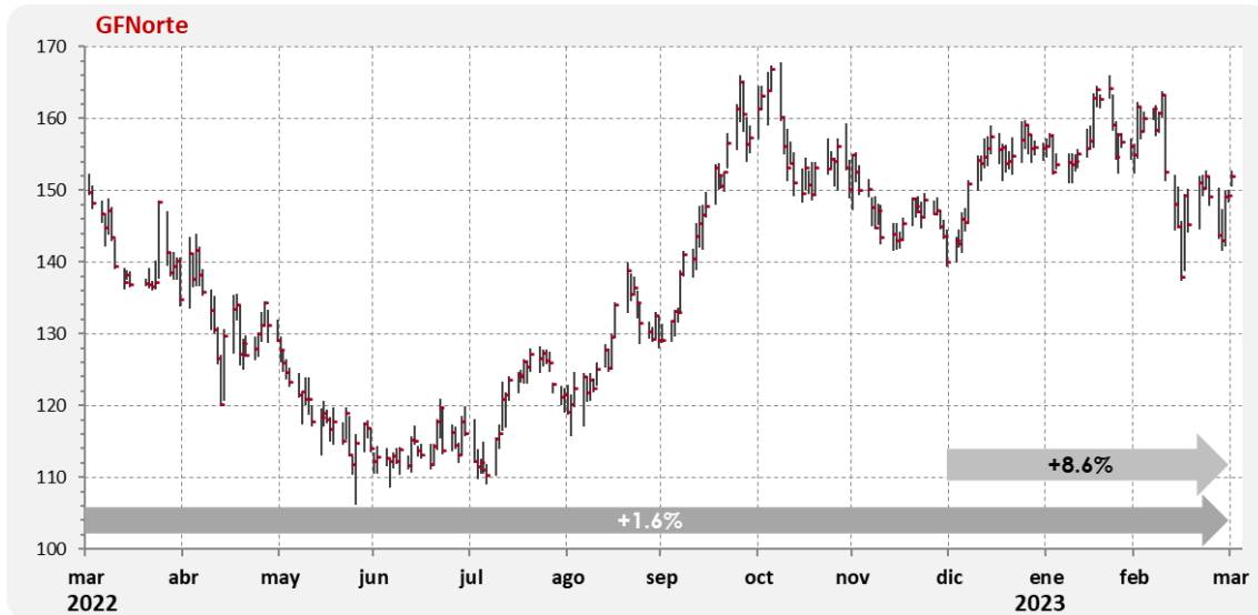
Gráfica 3. Comportamiento anual de la acción

El ROE al cierre del 1T23 alcanzó 21.5%. Por su parte, el ROA se situó en 2.5%.