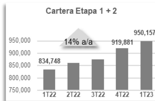
Gráfica 1. Cartera Vigente

La Cartera de Crédito al Consumo , que refleja el financiamiento a los hogares mexicanos, ascendió a 384,832 mdp, un crecimiento de 17% respecto al mismo periodo del año anterior.