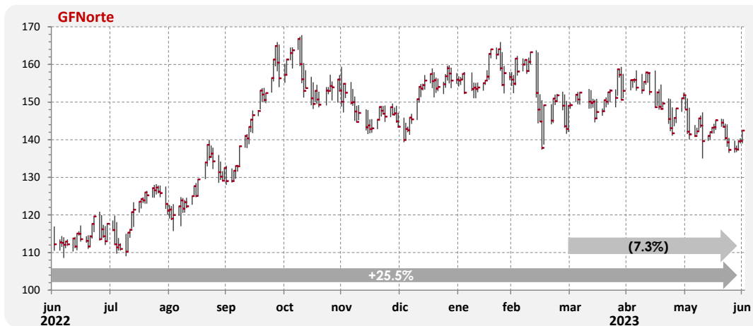
Gráfica 3. Comportamiento anual de la acción

El ROE al cierre del 2T23 alcanzó 21.4%. Por su parte, el ROA se situó en 2.4%.