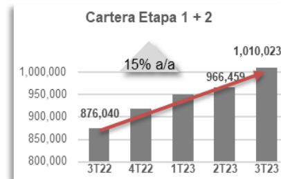
Gráfica 1. Cartera Vigente

La Cartera de Crédito al Consumo , que refleja el financiamiento a los hogares mexicanos, ascendió a 416,487 mdp, un crecimiento de 17% respecto al mismo periodo del año anterior.