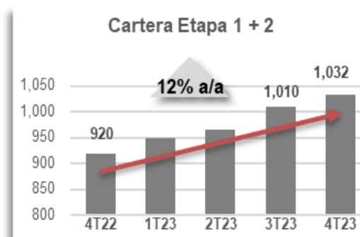
Gráfica 1. Cartera Vigente

Al cierre del trimestre, la Cartera de Crédito Vigente del grupo superó también el billón de pesos sumando 1,031,926 mdp, un crecimiento de 12% en su comparación anual.