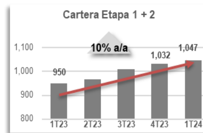
Gráfica 1. Cartera Vigente

La Cartera de Crédito al Consumo , que refleja el financiamiento a los hogares mexicanos, ascendió a 434,691 mdp, un crecimiento de 13% respecto al mismo periodo del año anterior.