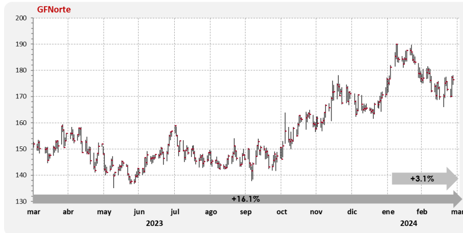
Gráfica 3. Comportamiento anual de la acción

El ROE del 1T24 alcanzó 22.2%. Por su parte, el ROA se situó en 2.4%.